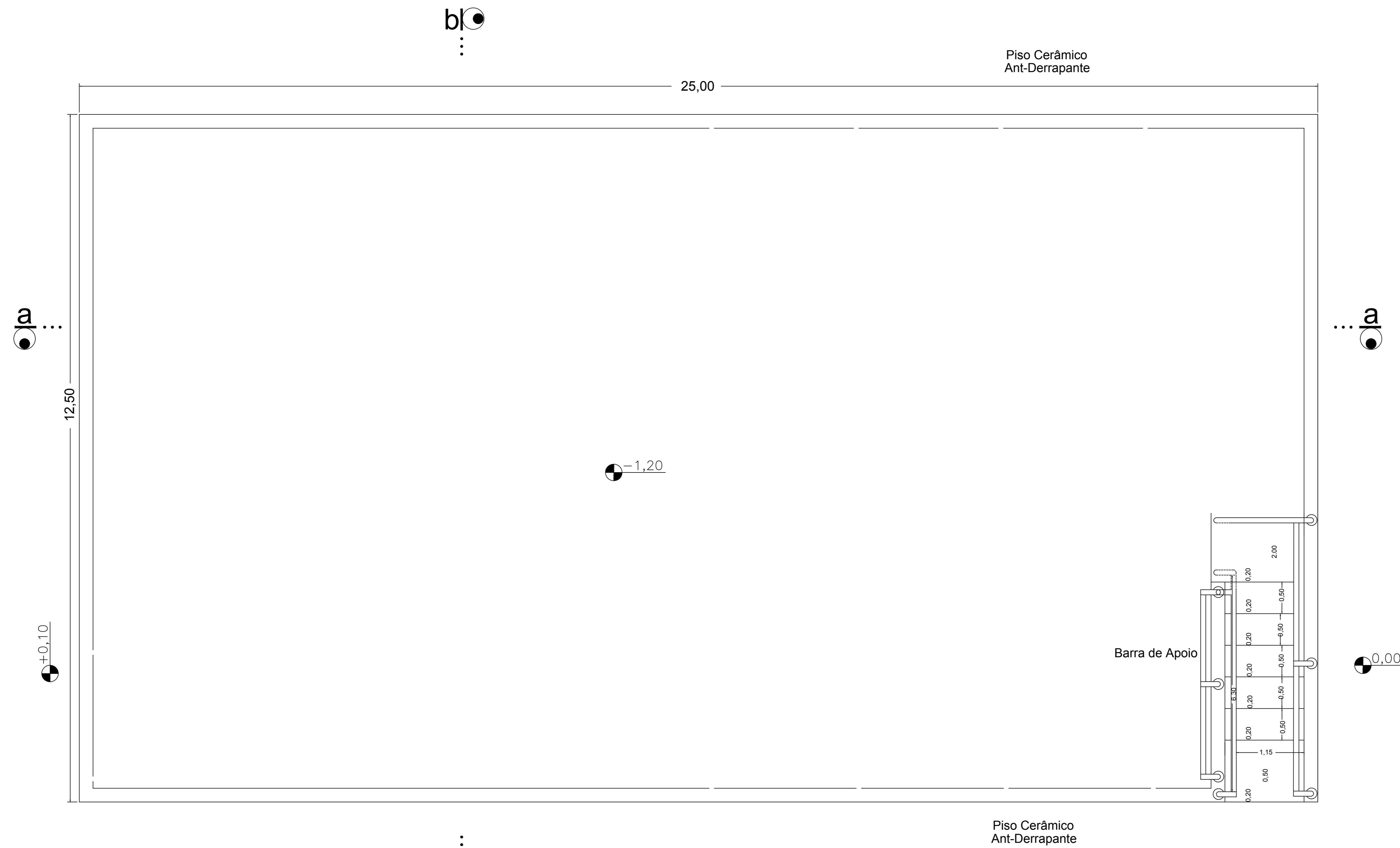
PLANTA BAIXA Esc. 1/50